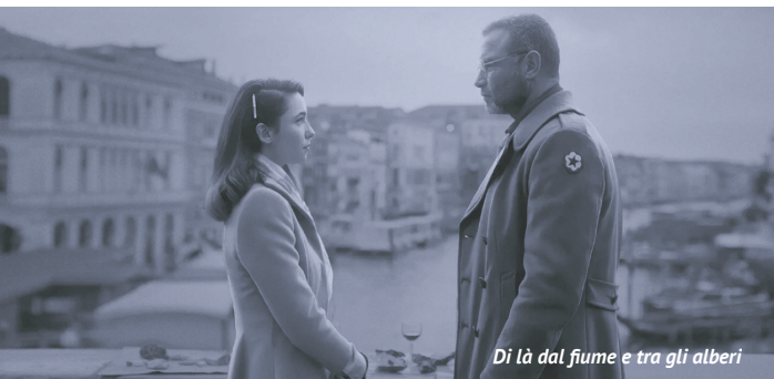
Di là dal fiume e tra gli alberi

È una fredda notte di gennaio, quando due giovani ladri in fuga, Beatrice Navi e Guido Cenere, approdano su un'isola, vengono sorpresi dal guardiano e condotti al cospetto dei proprietari della sontuosa Villa delle Ginestre. Nella Villa vive la strana famiglia Reffi. Il figlio del capofamiglia, Celestino Reffi, propone un patto ai due ragazzi: lui non li denuncerà e li nasconderà al Commissario Carrua che è sulle loro tracce, ma loro seguiranno una sorta di "corso di educazione".