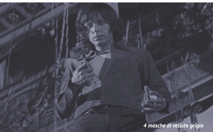
4 mosche di velluto grigio

Negli anni '30, nella grigia e repressiva Mosca staliniana, un giovane scrittore finisce travolto dallo scandalo: la sua pièce teatrale, colpevole di rappresentare Cristo con troppa umanità, viene censurata e stroncata dalla critica. Emarginato e disperato, trova conforto nell'incontro con Margherita, una donna bellissima e sposata, con cui nasce un amore travolgente e proibito. Spinto da questa passione, lo scrittore dà vita a un nuovo romanzo.